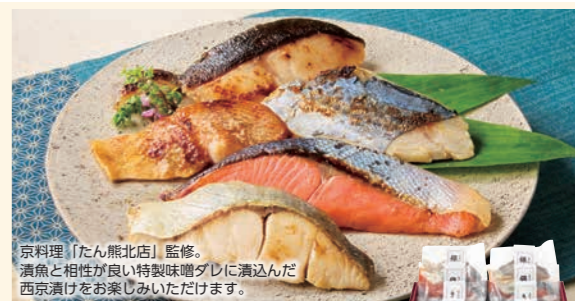
京料理「たん熊北店」監修。漬魚と相性が良い特製味噌ダレに漬込んだ西京漬けをお楽しみいただけます。