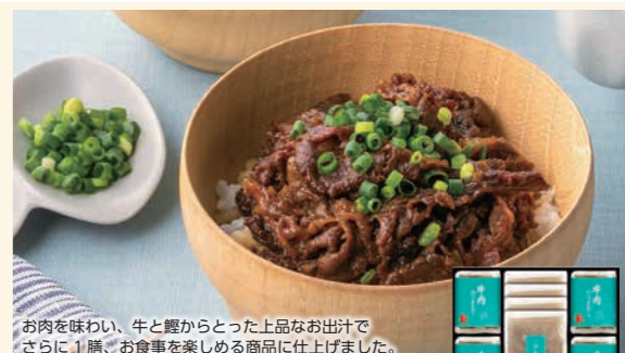
お肉を味わい、牛と豚からとった上品なお出汁でさらに1膳、お食事を楽しめる商品に仕上げました。