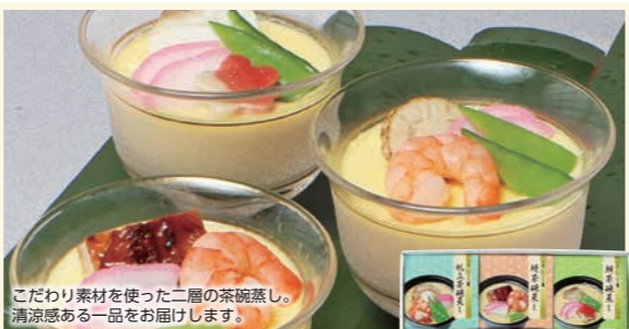
こだわり素材を使った二層の茶碗蒸し。清涼感ある一品をお届けします。

商品番号 747 型番 OT-30E 3,600円(税込3,888円)* ちりめんごはん・鶏そぼろごはん・たこめし・ちらし寿司・赤飯・十六穀米(さつまいも)各90g×各2