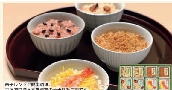
電子レンジで簡単調理。常温で日持ちする料亭の炊き込みご飯です。