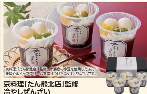
京料理「たん熊北店」監修。十勝産の小豆を使用したあんこ、栗餡やホイップクリームを盛りつけた冷やしぜんざい。

商品番号 756 型番 SD9-TK 4,800円(税込5,184円)* 銀さけ・銀ひらす・赤魚・さわら各60g×各2、銀だら60g