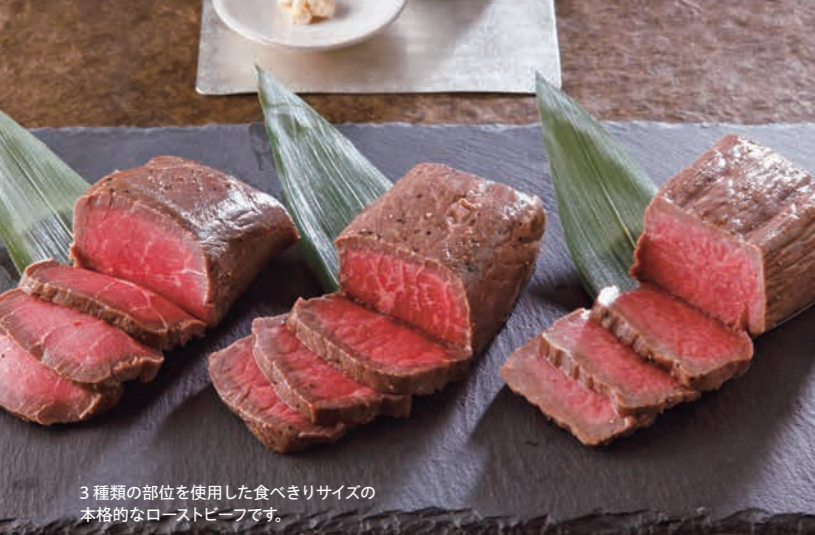
3種類の部位を使用した食べきりサイズの本格的なローストビーフです。