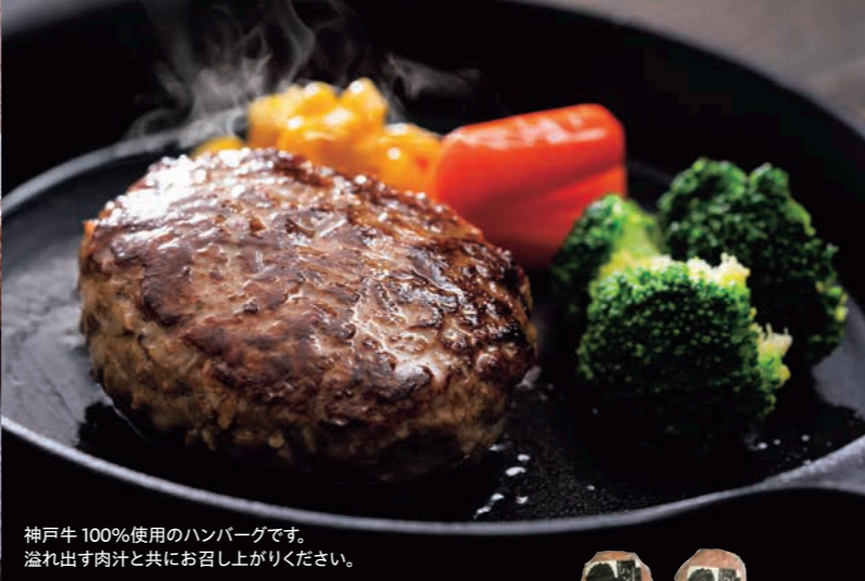
神戸牛100%使用のハンバーグです。溢れ出す肉汁と共に召し上がりください。